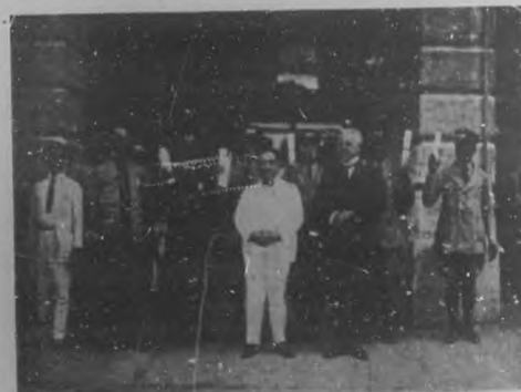
BOMBEROS PREMIADOS. —El popular Alcalde de la Habana con los bomberos que fueron premiados por sus meritos en el pasado año.