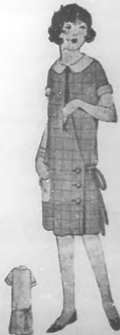
Lindo traje para niñas. Confeccionado en raieté color oro, con hilos en cuadro brillante. Botones de nácar en el cierre.

Es tiempo suficiente para que deje el luto. Puede asistir de un color pálido en cualquier tono que lo prefiera. He visto una tela preciosa en tono amarillo tierno, cruzado en cuadros menuditos, en plata, que resultaría muy propio. Si desea muestras, mande sobre franqueado con su dirección y recuerde la pregunta. Al traje orquídea, puede darle un tono rosa fuerte con el colorante Dip-it. Lo toma perfectamente, no mancha y una vez teñido y planchado, no vuelva a perderlo. Es líquido y puede (Pasa a la Pág. 31.)