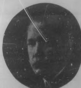
DR. COSME DE LA TORRIENTE Ilustre cubano, en cuyo honor se efectuó días pasados un suntuoso banquete.