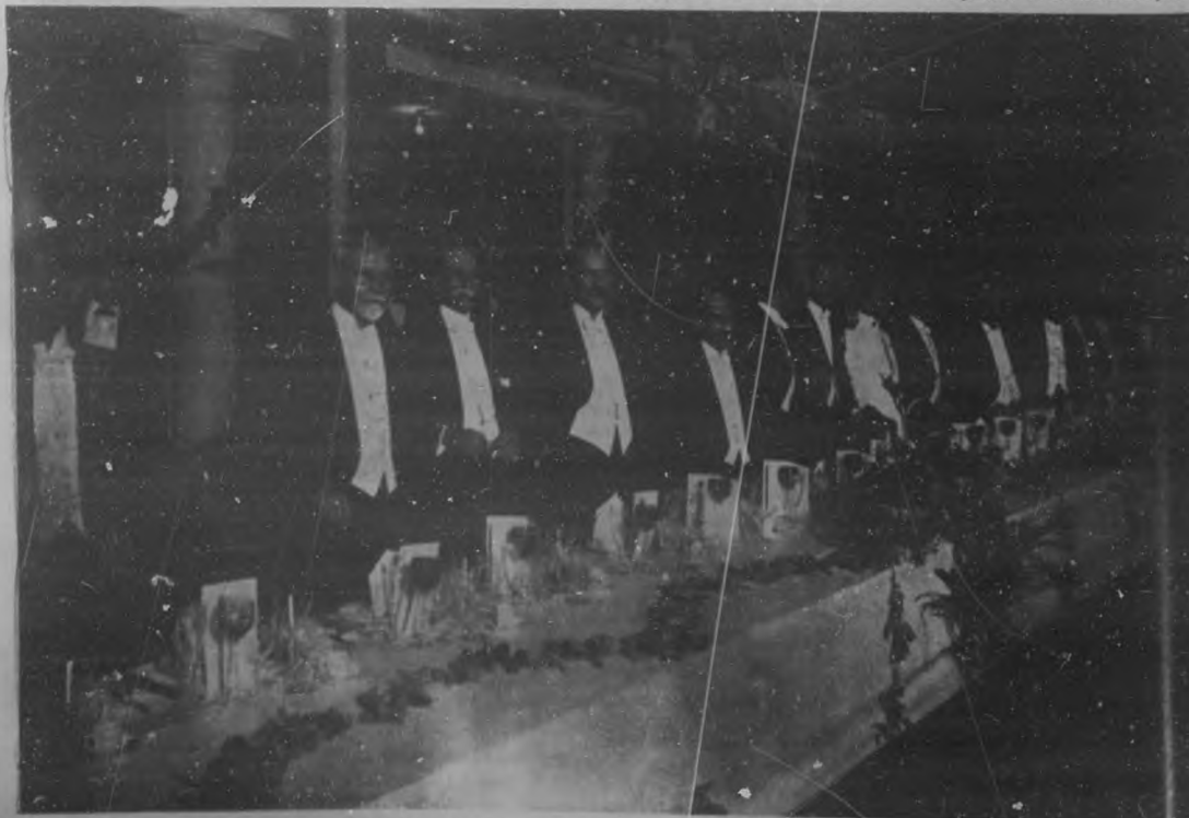
EN HONOR DE COSME DE LA TORRIENTE.—Presidencia del grandioso banquete.