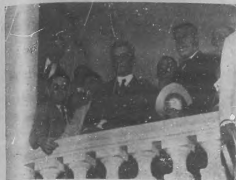
EL RECIBIMIENTO AL GRAL. MACHADO. —El Presidente electo saludando a los manifestantes desde el portal de su chalet.