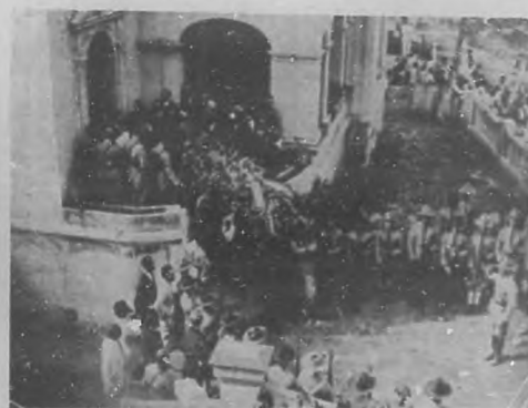
EL ENTIERRO DE UN PATRIOTA. —Momentos en que eran sacados los restos del ilustre patriota, general José Miró de la casa mortuoria.