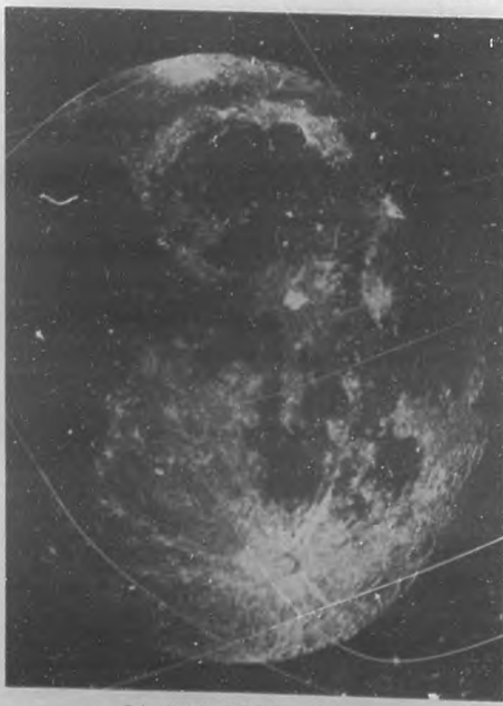
LA MISTERIOSA SELENE

Notable pensador cubano, autor de una extraordinaria, pero plausible teoría que supone habitados por seres psíquicos muy superiores a nosotros aquellos planetas de nuestro sistema que, como Marte o nuestro satélite la Luna, están más adelantados que la Tierra en su evolución cósmica.