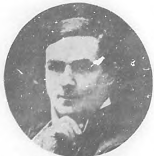
EL ABATE TH. MOREUX

Connotado astrónomo francés que acaba de publicar un libro donde expone la extraña teoría de que ninguno de los planetas de nuestro sistema solar debe estar habitado actualmente, aunque admite que algunos de ellos—como Marte o nuestro satélite la Luna—han podido tener habitantes.