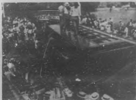
TREMENDO CHOQUE. —Estado en que quedó el tren eléctrico que chocó hace días con una locomotora cerca de la Ciénaga.