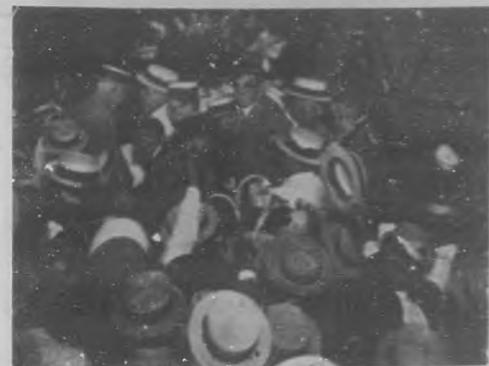
EL RECIBIMIENTO AL GRAL. MACHADO. —Momentos en que el Gral. Machado abandonaba el barco que lo trajo a esta ciudad.