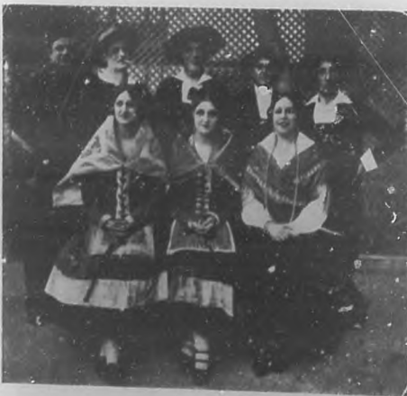
Varios artistas de la Compañía Santacruz, cuya magnífica labor en "La Bejarana", les ha conquistado aplausos múltiples.

El aristocrático cine anuncia para el sábado y el domingo la magistral producción "La Sirena de Sevilla", en la que luce su peregrina belleza Priscilla Dean y para el lunes, once, martes 12 y miércoles 13, pasará por la pantalla la interesante película "Bajo el manto rojo", por Alma Rubens y Robert B. Mantell.