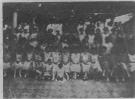
LA SOCIEDAD "CUBAN TELEPHONE Co." —Un grupo de las bellas damitas y correos jóvenes que componen esta simpática asociación.