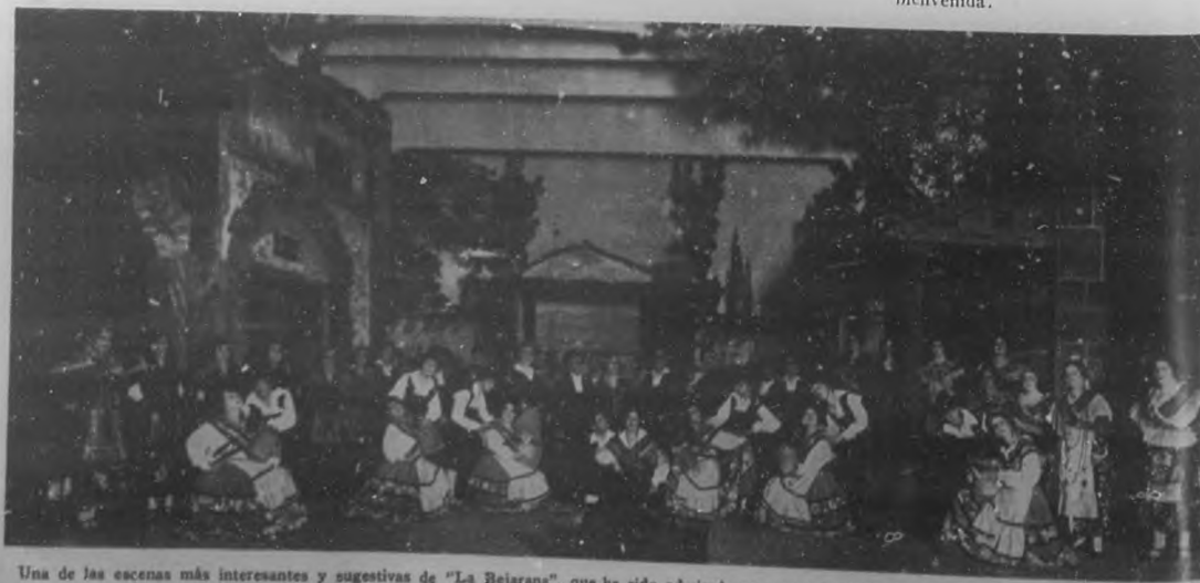
Una de las escenas más interesantes y sugestivas de "La Bejarana", que ha sido admirada por nuestro público en bellas noches de arte exquisito.